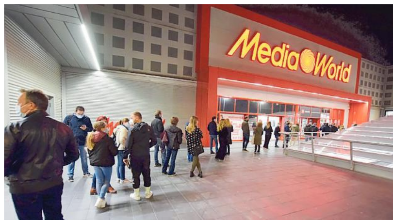
▲ In coda La file ieri sera per entrare in un megastore

Chiudono anticipatamente bar e ristoranti, si svuota il centro città e si riempiono i centri commerciali. In barba ai divieti di assembramento e alle norme che impongono un severo contingentamento all'interno di negozi e iperstore. Le fotografie – scattate nei pomeriggi del 29 e 30 ottobre – non mentono: lunghe code davanti a Mediaworld di Santa Caterina, tanto per dirne una, distanze di sicurezza non sempre rispettate, mascherine calate sul mento, molti bambini di età inferiore ai sei anni (per i quali le protezioni facciali non sono obbligatorie). Scene simili davanti ai McDonald's (a Santa Caterina come a Mungivacca), presi d'assalto anche dopo le 18, considerato che a quell'ora chiude il servizio al tavolo ma non quello d'asporto. E poi nelle gallerie commerciali, nei mega-rivenditori di casalinghi, negli store di bricolage, disseminati attorno alla tangenziale. I grandi punti vendita – con l'entrata in vigore del