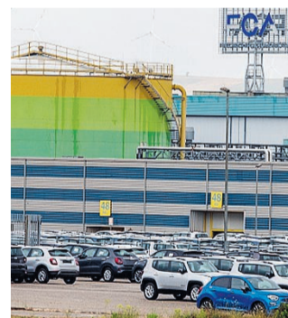
MELFI L'impianto della Fca