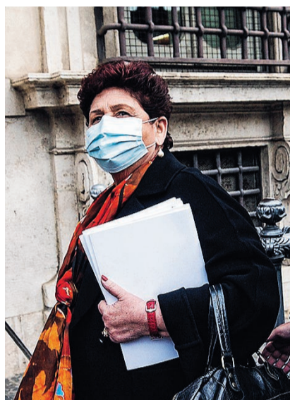
BELLANOVA La pugliese schierata da Renzi