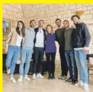
segue a pagina 8

START UP Saglio punta tutto sull'elettrico segue a pagina 8