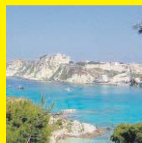
segue a pagina 3

TREMITI Corsa alla villa di Lucio Dalla segue a pagina 3