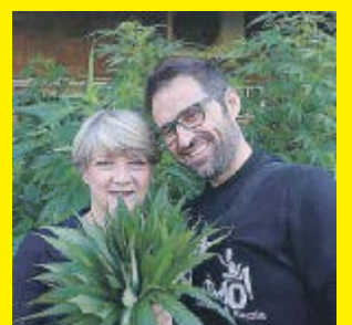
segue a pagina 6

LA STORIA Cannabis per curarsi Arrestato segue a pagina 6