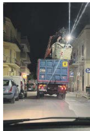
segue a pagina 18

Porta a porta tra luci e ombre segue a pagina 18