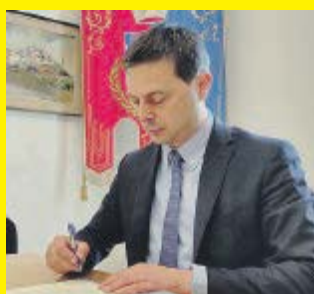
segue a pagina 7

POLITICA In Puglia M5S scompare dai radar segue a pagina 7