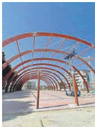
segue a pagina 15

IL PROGETTO Campi e negozi Riapre il Green Park segue a pagina 15